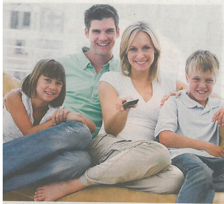
Vorne: Gemütlicher Familien-Fernsehabend